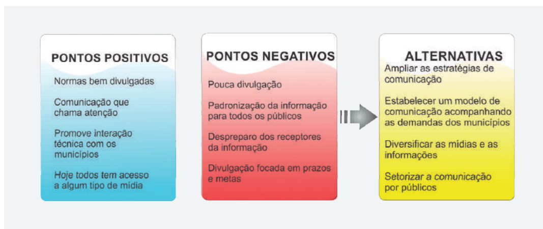
FIGURA 3 PONTOS POSITIVOS, PONTOS NEGATIVOS E ALTERNATIVAS

A perspectiva levantada pelos gestores municipais, além de apresentar os principais pontos positivos e negativos, tanto da PNRS como de seu modelo de comunicação, aponta alternativas descritas aqui como caminhos para o MMA buscar uma comunicação mais eficiente e eficaz. A síntese de tais discursos pode ser observada na figura 3.