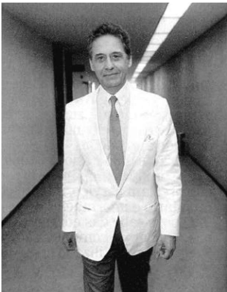
Fernando Henrique Cardoso, Senador