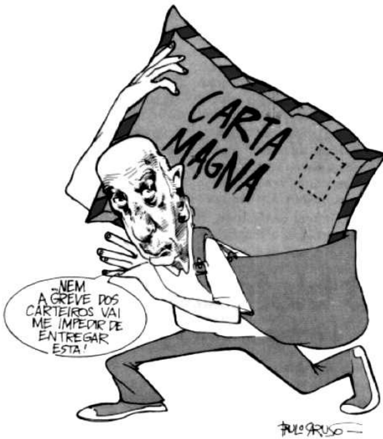
Charge por Paulo Caruso