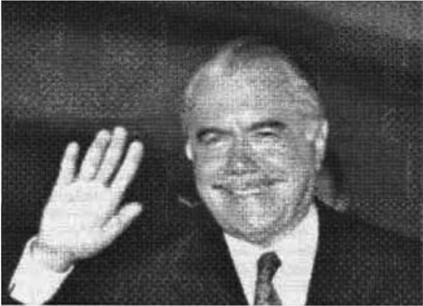
José Sarney, Presidente da República