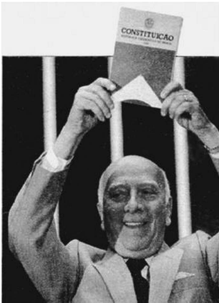
Ulysses Guimarães e a Constituição de 1988